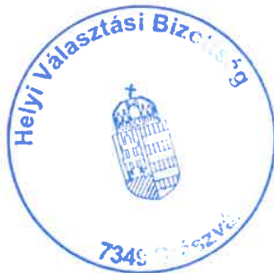
Havasi Béla Helyi Választási Bizottság elnöke