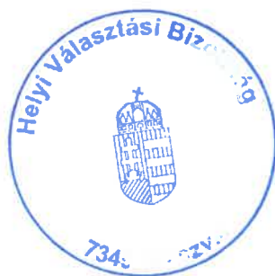
Havasi Béla Helyi Választási Bizottság elnöke